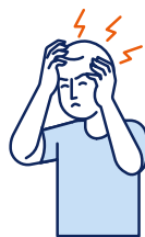
Maux de tête